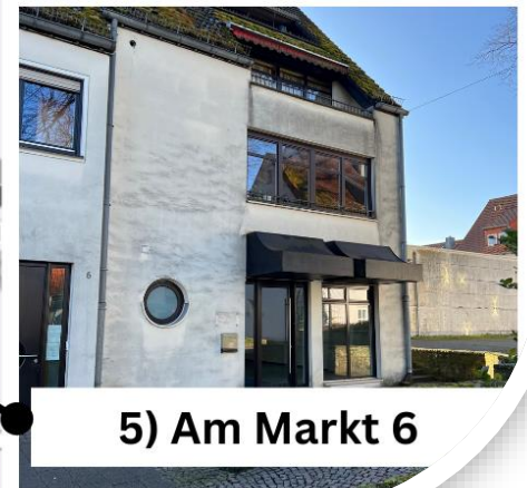
5) Am Markt 6