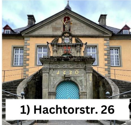
1) Hachtorstr. 26