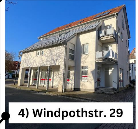
4) Windpothstr. 29