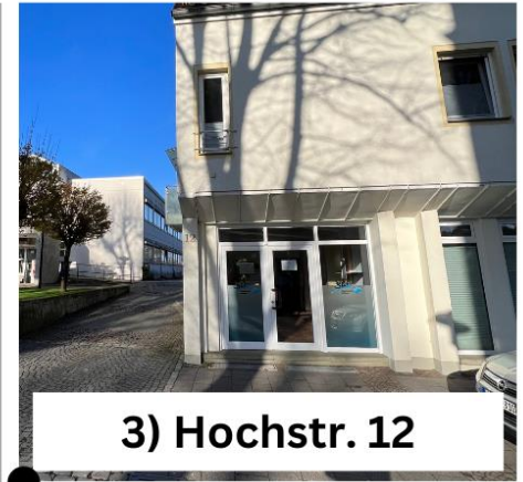
3) Hochstr. 12