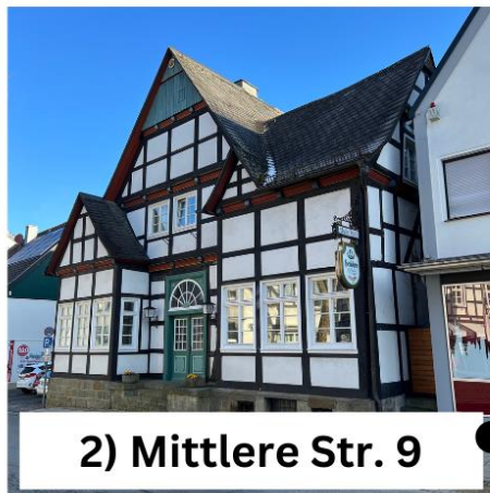
2) Mittlere Str. 9