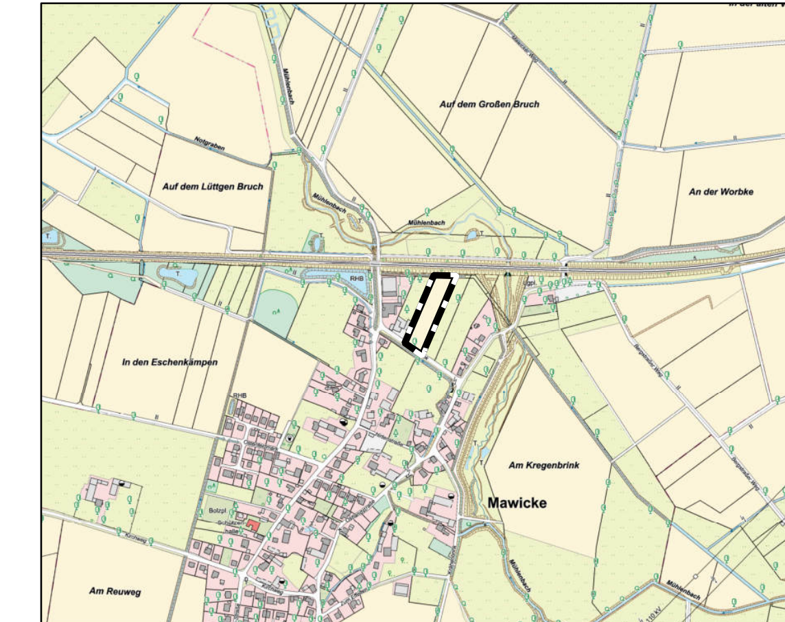
Übersichtsplan M. 1:10.000